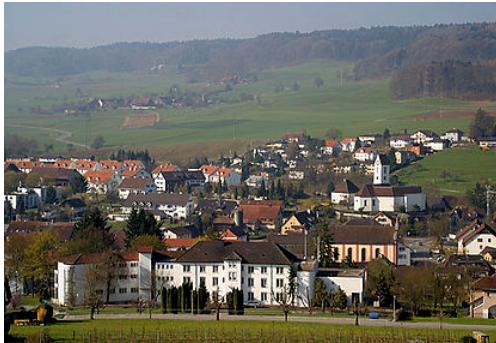
Vue du village de Lengnau.